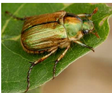
Anomala vitis . Esoscheletro senza ciuffi bianchi laterali e caudali (lunghezza: 15 mm).