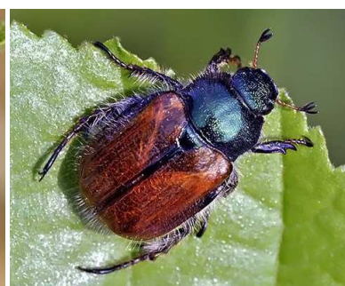
Maggiolino degli orti, Phyllopertha horticola . Esoscheletro più marrone e assenza dei ciuffi bianchi laterali e caudali (lunghezza: 10 mm).

Per ciò che attiene il focolaio nel Parco del Ticino è il primo per quanto riguarda tutta l'Europa continentale e al momento l'epicentro si trova nel Comune di Oleggio. Sia i colleghi lombardi che quelli piemontesi ci confermano la presenza dei primi adulti, emersi dalle larve nel terreno (in anticipo di circa una settimana rispetto all'anno scorso).